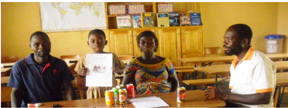
Die Bestätigung der Übernahme in das Zukunftschance Patenschaftsprojekt (Patenschaftsurkunde) wird überreicht.